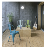
LaColloc Created by ENSTIB!