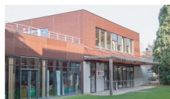
Resto U' Campus Bois (on campus)