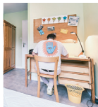
Maison de l'étudiant (4 residences)