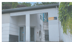
Resto U' La Louvière (town centre)